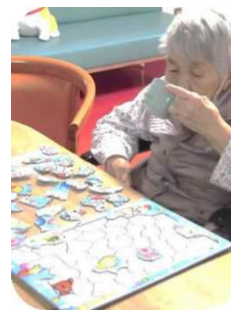
ちょっと一息 休憩タイム