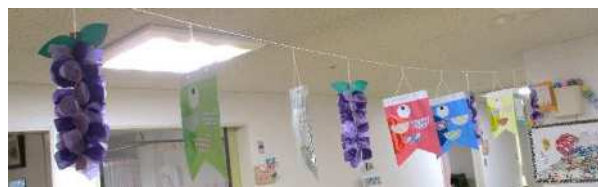
2階では鯉のぼりと藤の花で春を演出 鯉のぼりにはみんなの願いを書きました♥♥