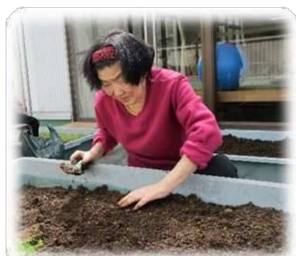
5階ベランダでは菜園の草取りをしました 今年は何が収穫できるかな？ トマト？ メロン？ 楽しみです☆☆