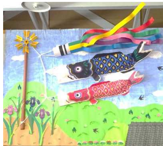
5月の壁画 「風薫る五月」