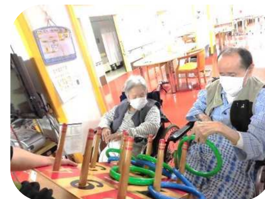
輪投げ 上手に入るかな？