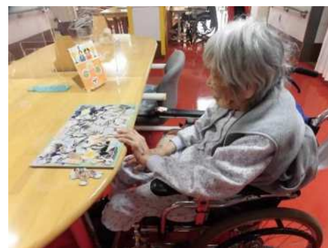
ジグソーパズル なかなか難しい！！