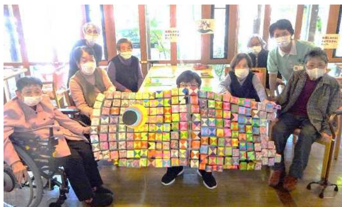
みんなで作った箱（200個？）を組み合わせ 鯉のぼりが完成♪